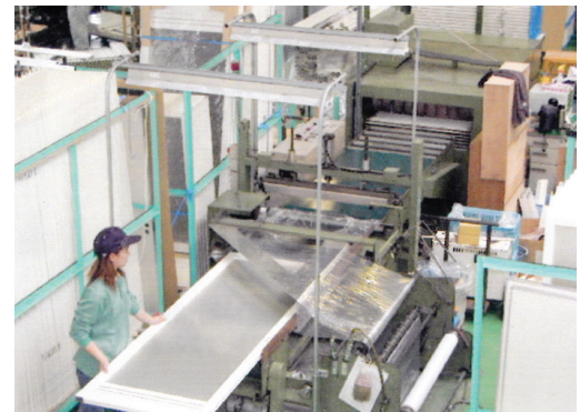
扉シュリンク設備

当社の「我が社の心 10 カ条」の中に、「お客様は我が社の命である。お客様は私達なしでも生きて行けるが、私達はお客様なしでは生きていけない。」という1条がある。顧客第一の心がここにあると感じた。